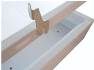
Sistema de cierre para ajuste de pantalla.